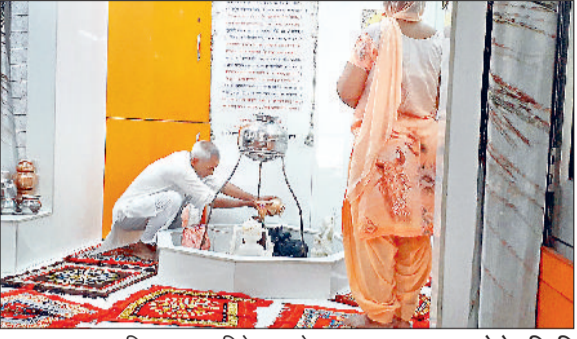
झज्जर। भगवान शिव का जलाभिषेक करते हुए श्रद्धालु।

■ भगवान शिव की आराधना के लिए सावन माह को सबसे उत्तम माना जाता है