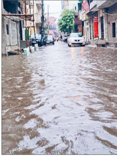
बहादुरगढ़। मांडोली बाजार में हुआ जलभराव।

रक्षा बंधन के दिन इलाके में मौसम ने करवट ली और शनिवार की सुबह झमाझम बारिश हुई। दिनभर आसामान में बादल छाए रहे। दोपहर से शाम तक भी बूंदबांदी का दौर चला। कुल मिलाकर 32 एमएम बारिश दर्ज की गई। बारिश के चलते अधिकतम तापमान में शुक्रवार के मुकाबले करीब छह डिग्री की गिरावट दर्ज की गई। शुक्रवार को जहां पर 36 डिग्री सेल्सियस पर था, वहीं शनिवार को यह घटकर 30 डिग्री सेल्सियस पर पहुंच गया। लोगों को उमस और गर्मी से कुछ राहत मिली। तेज बारिश के कारण शहर की कई सड़कों और गलियों में पानी भर गया। जलभराव के बीच जगह-जगह सड़कों पर बने गड्ढों ने लोगों की मुश्किलें बढ़ा दीं। कुछ कॉलोनियों में घंटों तक जलभराव की स्थिति बनी रही, जिससे लोगों को आने-जाने में दिक्कत हुई। बारिश ने रक्षाबंधन के दिन बाजारों की रौनक भी फीकी कर दी। आमतौर पर त्योहार के दिन खरीदारों की अच्छी खासी भीड़ रहती है, लेकिन बारिश के चलते ग्राहक कम पहुंचे। दुकानदारों ने बताया कि रक्षाबंधन पर कई लोग आखिरी समय पर खरीदारी करते हैं, लेकिन बारिश की वजह से