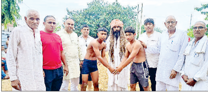
झंझर। कुश्ती शुरू करवाते आयोजक समिति सदस्य।

कुश्ती लड़ने के लिए प्रदेश भर से पहुंचे पहलवान