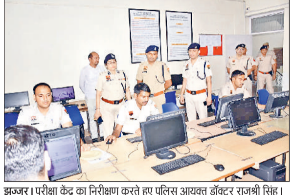
झज्जर। परीक्षा केंद्र का निरीक्षण करते हुए पुलिस आयुक्त डॉक्टर राजश्री सिंह।

■ जिले के महिला और पुरुष पुलिस के 181 जवानों ने हिस्सा लिया जिनमें से 43 कर्मचारियों ने परीक्षा पास की