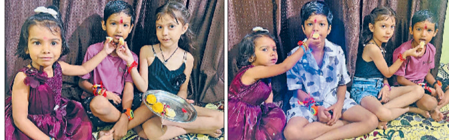
बहादुरगढ़। भाई-बहन के अटूट प्रेम व स्नेह का पर्व रक्षाबंधन इलाके में हर्षोल्लास और पारंपरिक उमंग के साथ मनाया गया। सुबह से ही शहर और आसपास के गांवों में इस पवित्र त्यौहार की रौनक बिखर गई। बहनों ने भाइयों की कलाई पर रक्षा सूत्र बांधकर उनके सुख, समृद्धि और दीर्घायु की कामना की। वहीं भाइयों ने बहनों की रक्षा का संकल्प लेते हुए उन्हें उपहार भेंट किए। रेलवे स्टेशन, बस स्टैंड, मेट्रो स्टेशनों पर शनिवार को काफी भीड़भाड़ देखने को मिली। बरसात खत्म होने के बाद बाजारों में भी खूब रौनक हुई। मिठाई की दुकानों

पर लंबी कतारों और राखी-गिफ्ट की दुकानों पर जमकर खरीदारी होती रही। रंग-बिरंगी राखियां, खूबसूरत गिफ्ट पैक व मिठाइयों की महक ने त्यौहार के माहौल को और भी खुलनुमा बना दिया। नन्हे-नन्हे बच्चों