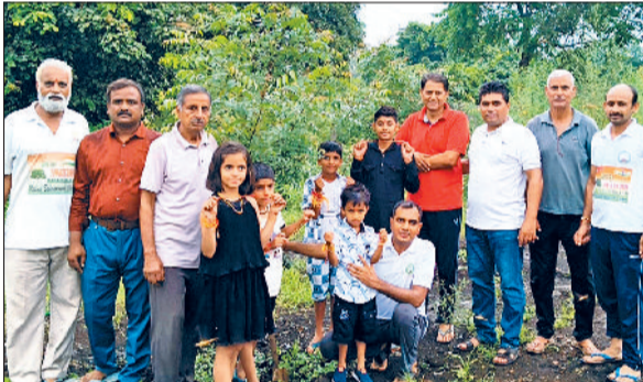
बहादुरगढ़। पेड़, पौधों को राखी बांधने पहुंचे ट्रस्ट के सदस्य व बच्चे।

उंट की सवारी रही आकर्षण का केंद्र : तीज मेले में जहां विभिन्न प्रकार के झूले लगे थे वहीं अबकी बार उंट की सवारी आकर्षण का केंद्र रही। अभिभावकों ने अपने बच्चों को उंट की सवारी कराई। उंट मालिक द्वारा बच्चों को ऊपर चढ़ाने व उतारने के लिए एक सीढ़ी गई थी। जिसके माध्यम से बच्चों को ऊपर बिठाया जाता। इसके बाद मेले का एक चक्कर लगाने के बाद बच्चों को नीचे उतार दिया जाता। इसके अलावा लाइटिंग वाले सींगों ने भी बच्चों का ध्यान आकर्षित करवाया।