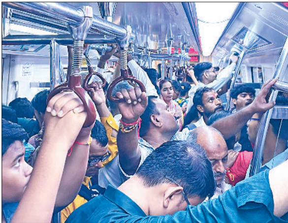
बहादुरगढ़। शाम के वकत मेट्रो में यात्रियों की भीड़।

बढ़ी हुई सुरक्षा व्यवस्था के चलते पीक आवर्स में मेट्रो स्टेशन पर यात्रियों की कतार लगेगी। इसलिए यात्रियों को अपने गंतव्य तक पहुंचने में अधिक समय लग सकता है। डीएमआरसी अधिकारियों ने कहा है कि यात्री अपनी यात्रा की योजना पहले से बनाएं। वे 16 अगस्त तक पर्याप्त समय यानी दस से 15 मिनट पहले घर से निकलें। साथ ही, स्टेशन पर प्रवेश के समय अपना सामान जांच के लिए तैयार रखें और केंद्रीय औद्योगिक सुरक्षा बल के जवानों का सहयोग करें। दिल्ली मेट्रो के सभी प्रमुख और संवेदनशील स्टेशनों पर अतिरिक्त सुरक्षा कर्मी तैनात किए गए हैं।