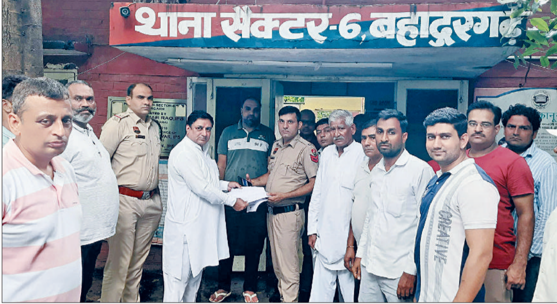
बहादुरगढ़। थाने में पुलिस को शिकायत देते सरपंच प्रतिनिधि व ग्रामीण।