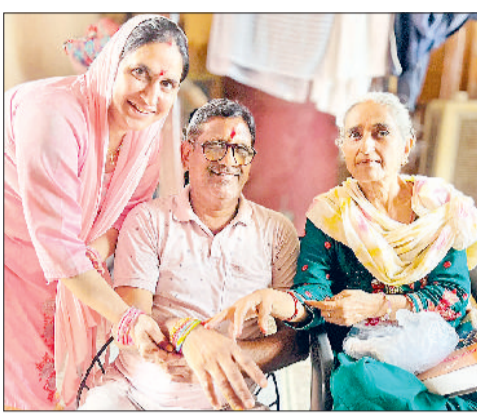
झज्जर। भाई को रक्षासूत्र बांधते हुए बहनें तथा मेले में ऊंट की सवारी करते हुए बच्चे और झूलों पर झूलते हुए बच्चे व इंतजार करते अभिभावक।

भाई बहन के प्रेम का प्रतीक रक्षाबंधन का पर्व जिले भर में हर्षोल्लास के साथ मनाया गया। दिनभर होती रही हल्की बारिश के बावजूद बहनें अपने भाइयों के घरों पर पहुंचीं और भाइयों की कलाईयों पर रक्षा सूत्र बांधकर उनकी लंबी आयु की कामना की। वहीं भाइयों ने भी अपनी बहनों की रक्षा करने का वचन देते हुए सम्मान स्वरूप उपहार भेंट किए। रक्षा बंधन पर्व के चलते जहां दिनभर बाजारों में रौनक रही, वहीं बस स्टैंड परिसर के बाहर अंबेडकर चौक, पुराना बस अड्डा रोड क्षेत्र में चाहनों की अधिक आवाजही के चलते जाम की स्थिति बनी रही। उधर, पर्व के चलते पुलिस के स्तर पर सुरक्षा के पुख्ता इंतजाम किए गए। शहर के प्रमुख बाजारों, सड़कों व बस स्टैंड परिसर में पुलिस