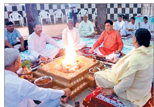
बहादुरगढ़। श्रावणी पर्व पर आयोजित किया गया यज्ञ।