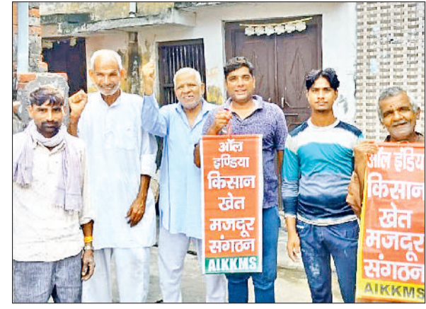
झज्जर। प्रदर्शन में उपस्थित ऑल इंडिया किसान खेत मजदूर संगठन कार्यकर्ता।